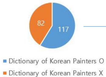
199 Korean Artist in ULAN (2023. 1.)

77 Korean artists selected for supplementation