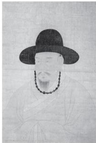
김치순 한글재심도 1584

주요작품 | 寒林雪霽圖 | 童子牽鵝圖 | 牧牛圖 | 黃牛圖 | 夏山暮雨圖 | 牛背渡河圖