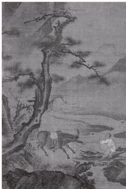
권시 | 독자견해도

〈한림계절도〉와 달리 〈동자권려도〉에서는 절파계 화풍이 적극적으로 구사되었다. 〈동자권려도〉는 조선 중기의 신수화 중에서 절파계 화풍을 보여주는 가장 이른 작품으로 잘 알려져 있다. 개울을 건너지 않으려고 고집을 부리는 나귀의 고삐를 당기며 안간힘을 쓰는 어린 동자의 모습을 신수를 배경으로 표현한 이 그림은 김시의 뛰어난 묘사력과 함께 뚜렷한 절파적