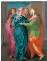
9. Pontormo Italian (Florentine), 1494 - 1557 The Visitation, About 1528-29 Oil on wood panel Unframed: 202 × 156 cm (79 1/2 × 61 7/16 in.) Parrocchia di San Michele Arcangelo a Carmignano (Prato). Su concessione della Soprintendenza Archeologia, Belle Arti e Paesaggio per la Città Metropolitana di Firenze e per le Province di Pistoia e Prato. EX.2019.1.6