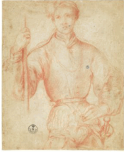
5. Pontormo Italian (Florentine), 1494 - 1557 Study for Portrait of a Halberdier, About 1529-30 Red chalk, border partially indicated in red chalk along the bottom edge on paper Unframed: 20.9 × 16.9 cm (8 1/4 × 6 5/8 in.) Firenze, Gallerie degli Uffizi, Gabinetto Disegni e delle Stampe. EX.2019.1.2