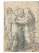
8. Pontormo Italian (Florentine), 1494 - 1557 Study for the Visitation, About 1528-29 Black chalk, traces of white chalk, squared with red chalk on paper Unframed: 47 × 34 cm (18 1/2 × 13 3/8 in.) Firenze, Gallerie degli Uffizi, Gabinetto Disegni e delle Stampe. EX.2019.1.5