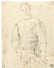
7. Pontormo Italian (Florentine), 1494 - 1557 Study for a Portrait of an Armed Youth, About 1529-30 Black chalk on paper Unframed: 25.3 × 20.6 cm (9 15/16 × 8 1/8 in.) Firenze, Gallerie degli Uffizi, Gabinetto Disegni e delle Stampe. EX.2019.1.4